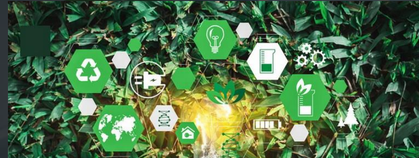
1. BCG Model