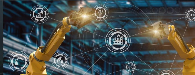
2. Technology and Innovation