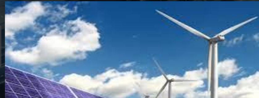
4. Renewable Energy for Industrial Sector