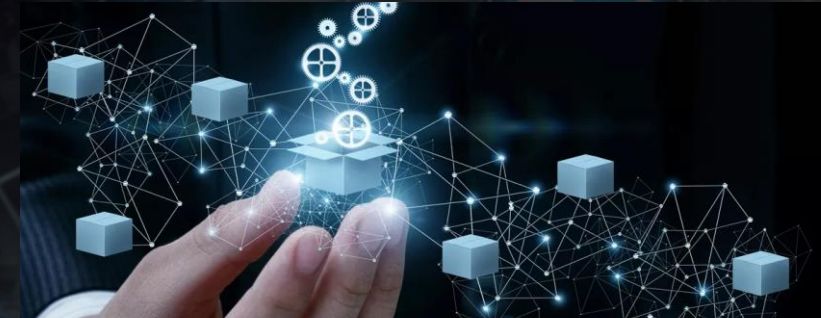
3. Focus on Supply Chain Security