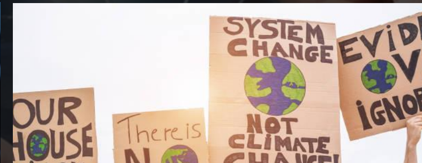
6. Climate change