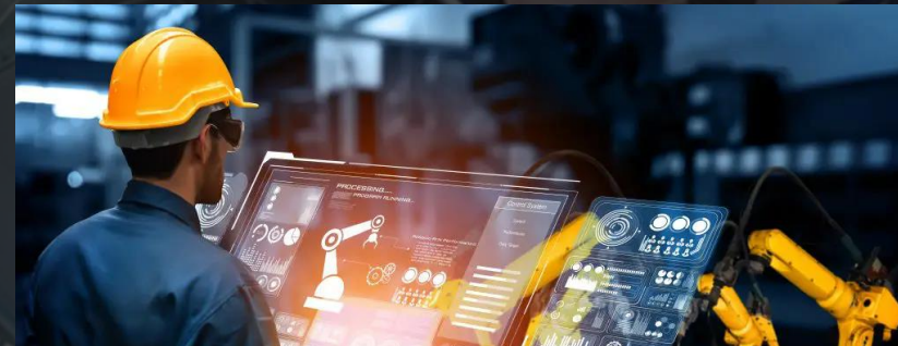
5. Upskill, Reskill Labor